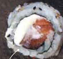
Salmone e philadelphia