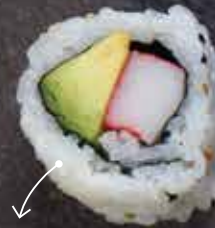
Polpa di granchio e avocado