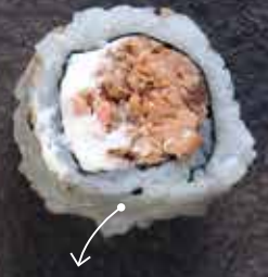
Salmone cotto e philadelphia