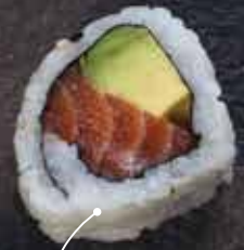
Salmone e avocado