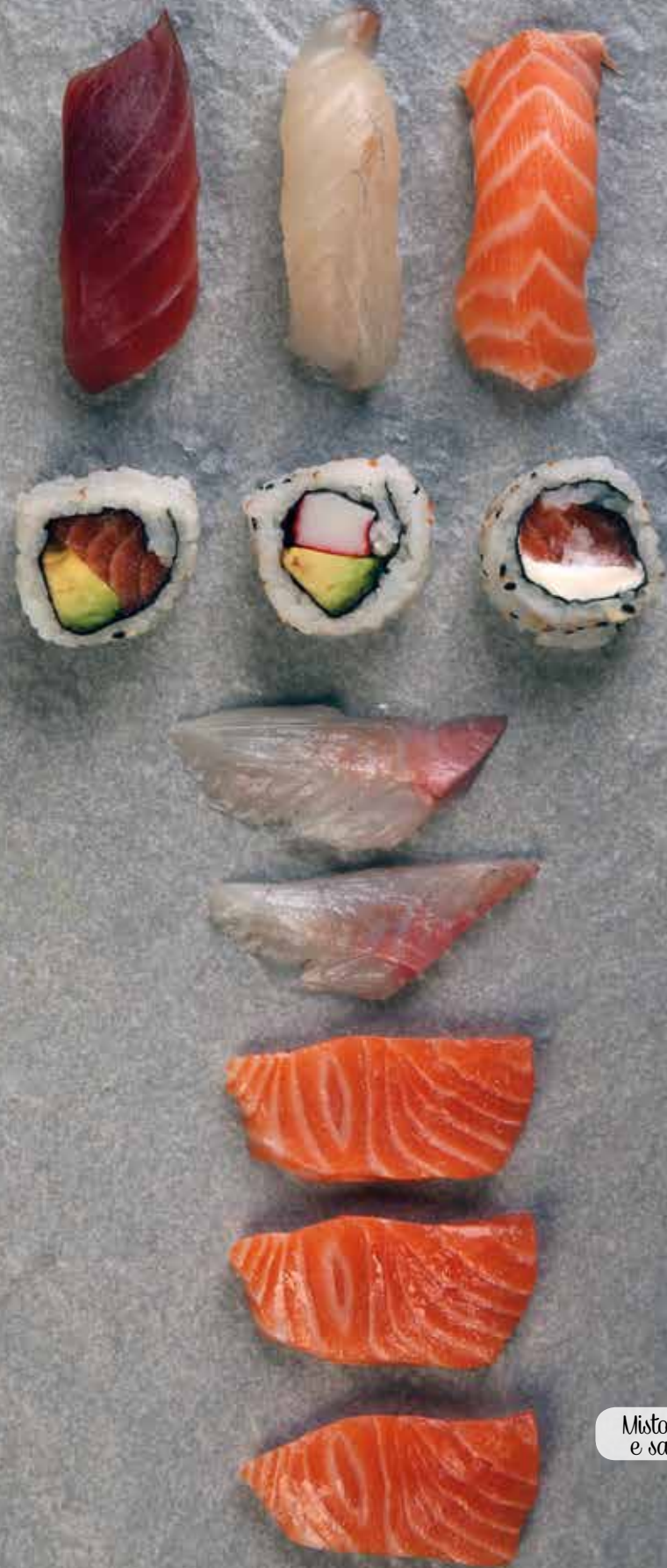
Misto sushi e sashimi